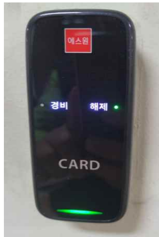
<카드리더기 상세 모습>