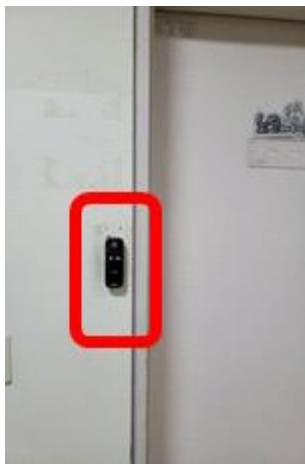
<카드리더기 부착 모습>