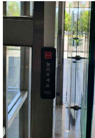
② 내부 출입문 개방 버튼