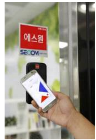
<모바일카드 사용 모습>